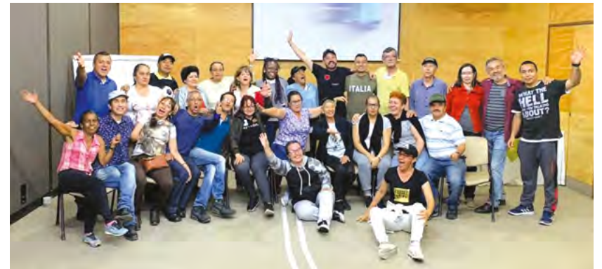
Sesión descentralizada del CCP, Parque de Piedras Blancas, septiembre 15 de 2019.

Tenemos contemplado hacer un evento de cierre el 30 de octubre en el auditorio del Ferrocarril de Antioquia. Allí presentaremos un balance del proyecto con los alcances y resultados. También vamos a tener como invitados a actores importantes del Consejo Comunal de Planeación - CCP y el Comité Gestor del Plan de Desarrollo. Además, vamos a certificar a las personas que hicieron los diplomados. Igualmente, en este mismo acto, se les va a hacer un reconocimiento a las organizaciones que ganaron la realización de proyectos relacionados con el PDL. Esta convocatoria se realizó en el marco del programa Rutas de Gestión. En promedio se entregaron 11 millones de pesos a cada una de las organizaciones para la ejecución de los proyectos.