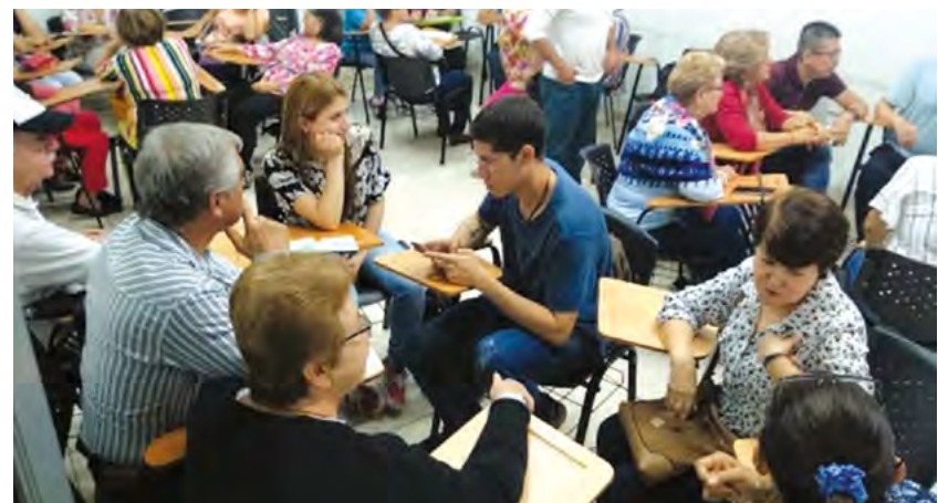
Seminario taller sobre el Plan de Desarrollo Local, barrio Bomboná 1.