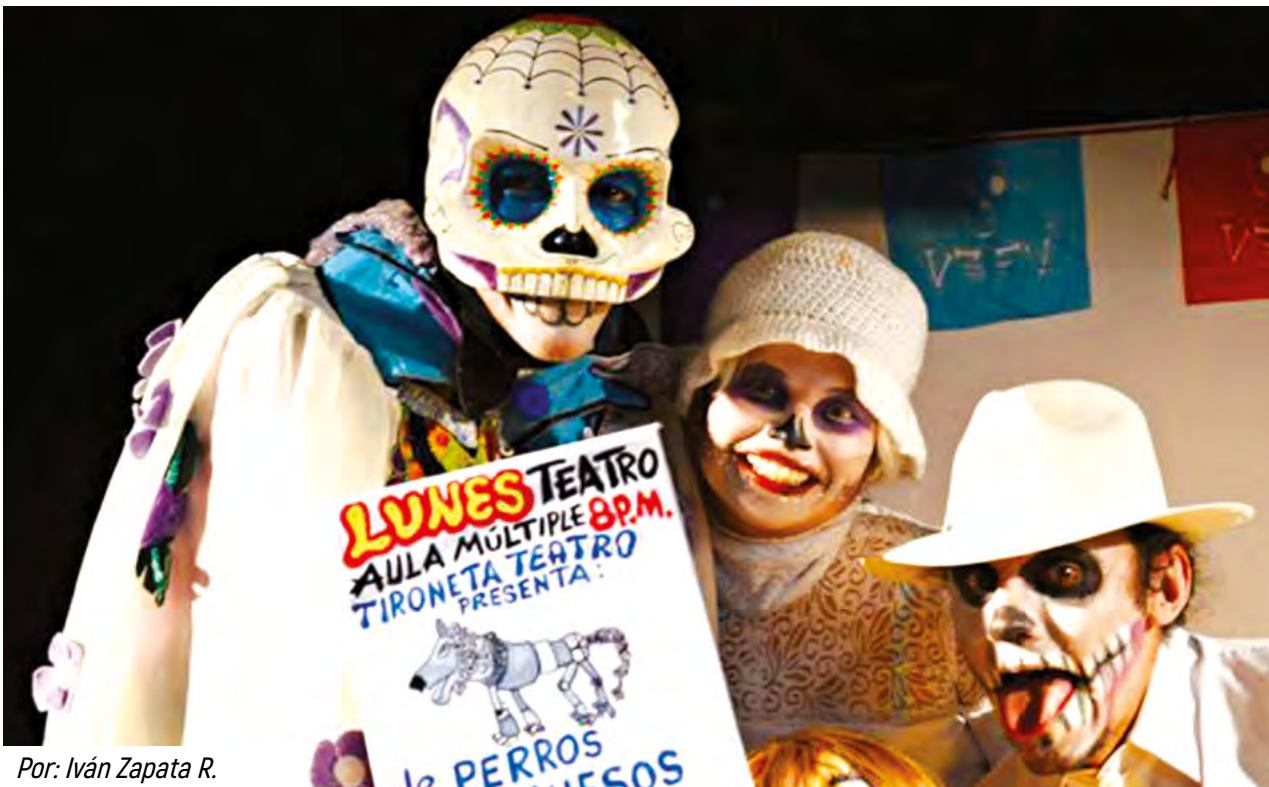
Por: Iván Zapata R.

Medellín en Escena: ¿Cómo y cuándo surgió Tironeta?