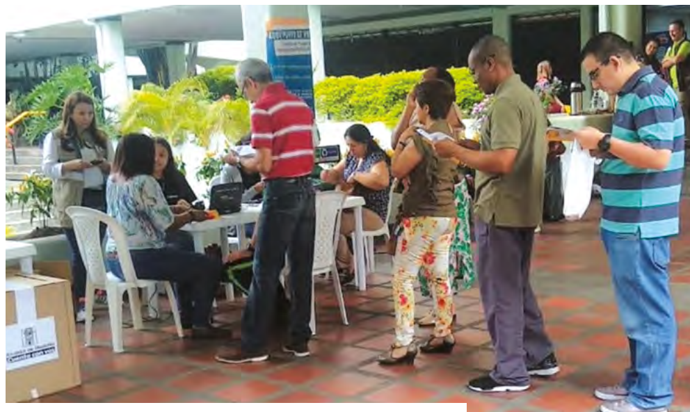
Punto de votación en las Torres de Bomboná, septiembre 29 de 2019.

Una de las fases del programa de Planeación Local y Presupuesto Participativo es la priorización participativa de los proyectos a ejecutar en la vigencia del año siguiente. La formulación de estos proyectos se realiza de acuerdo con las líneas del Plan de Desarrollo Local, PDL.