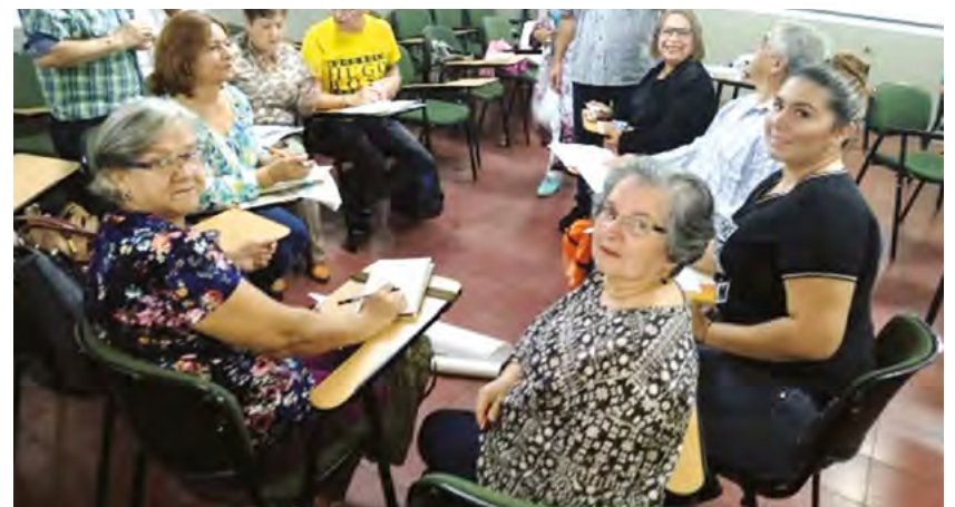
Estudiantes del diplomado en Prospectiva para el Desarrollo.

Encuentro ciudadano priorizado con recursos del Programa de Planeación Local y Presupuesto Participativo de la Comuna 10 La Candelaria