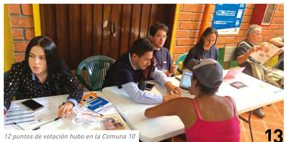
12 puntos de votación hubo en la Comuna 10