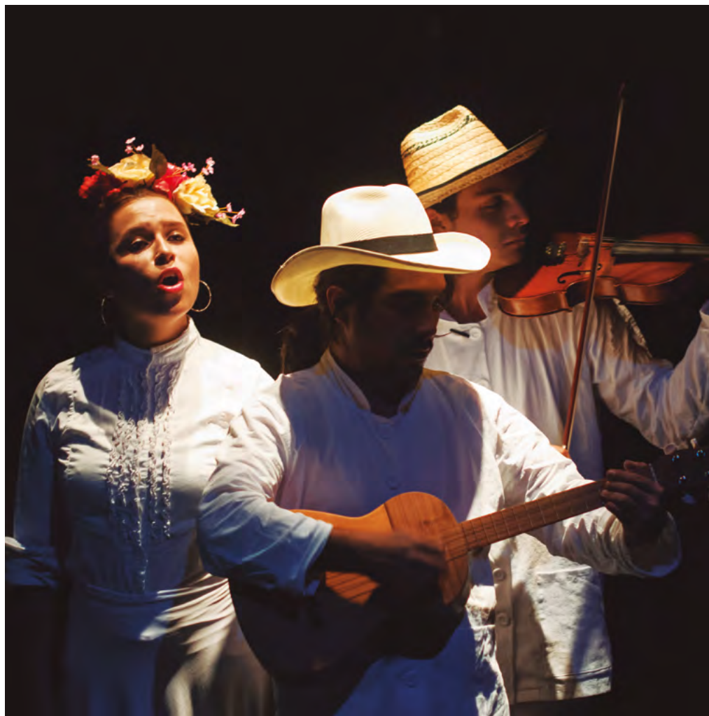
Escena de la obra Amnesia , estrenada recientemente.

El arte nos salvará , decía Jean Cocteau, esa es nuestra consigna.