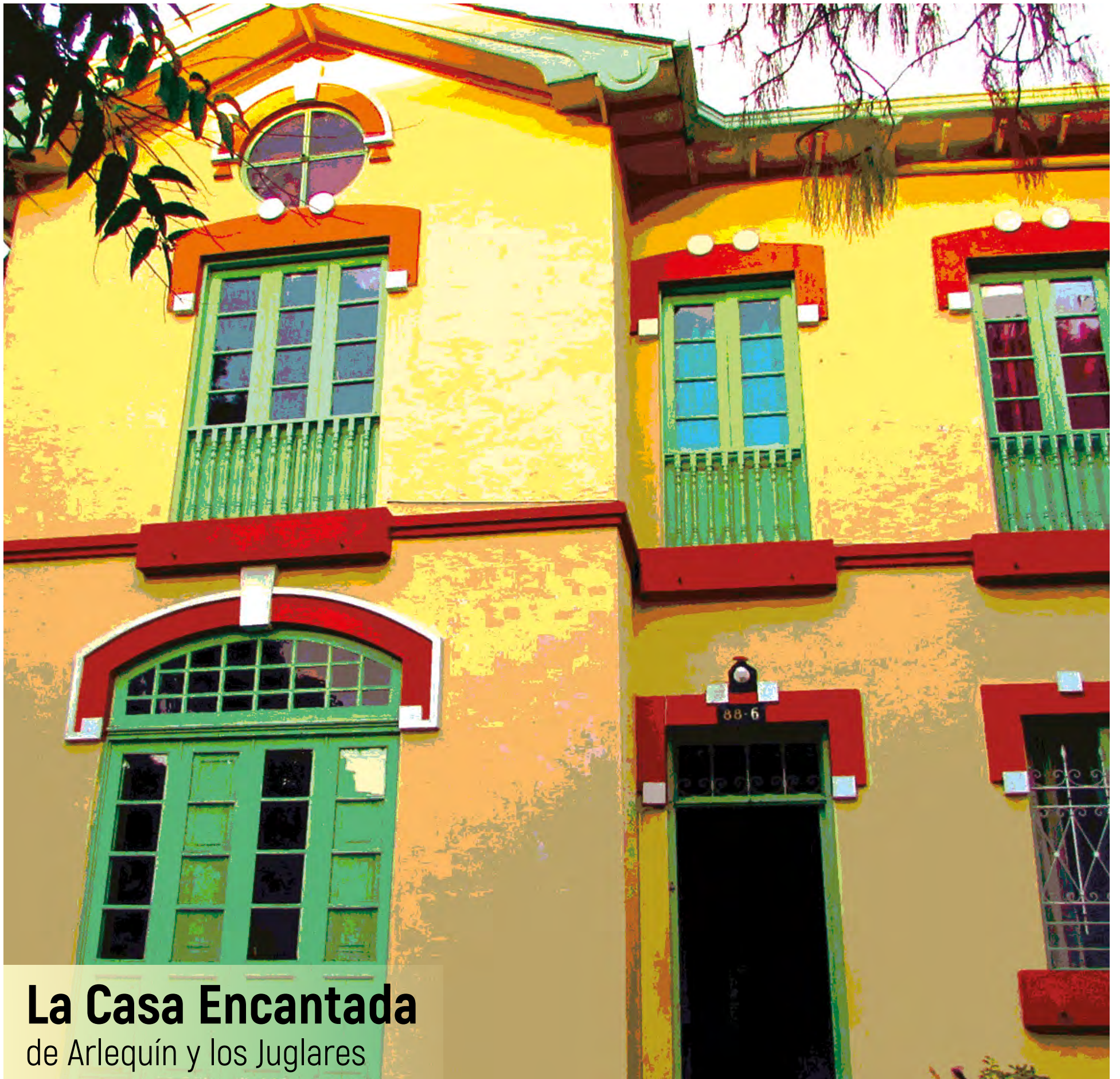
La Casa Encantada de Arlequín y los Juglares